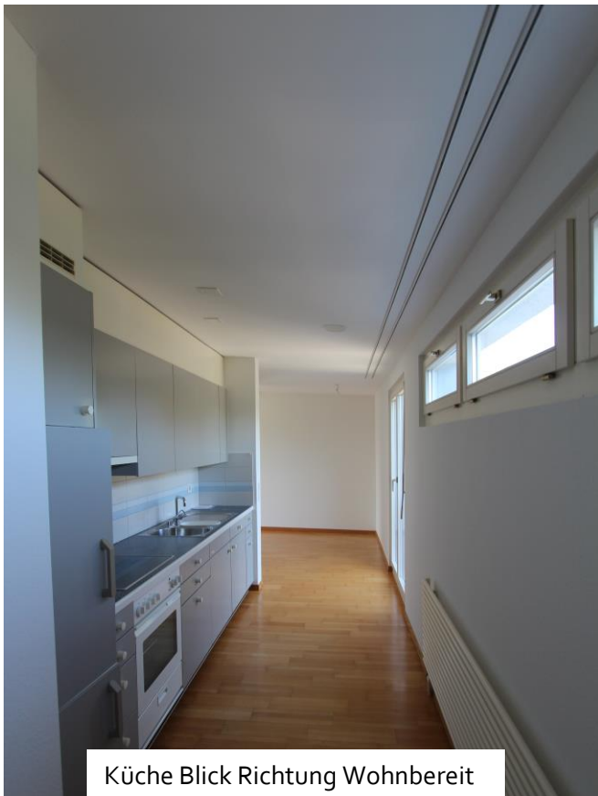
Küche Blick Richtung Wohnbereich