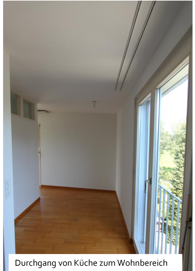
Durchgang von Küche zum Wohnbereich