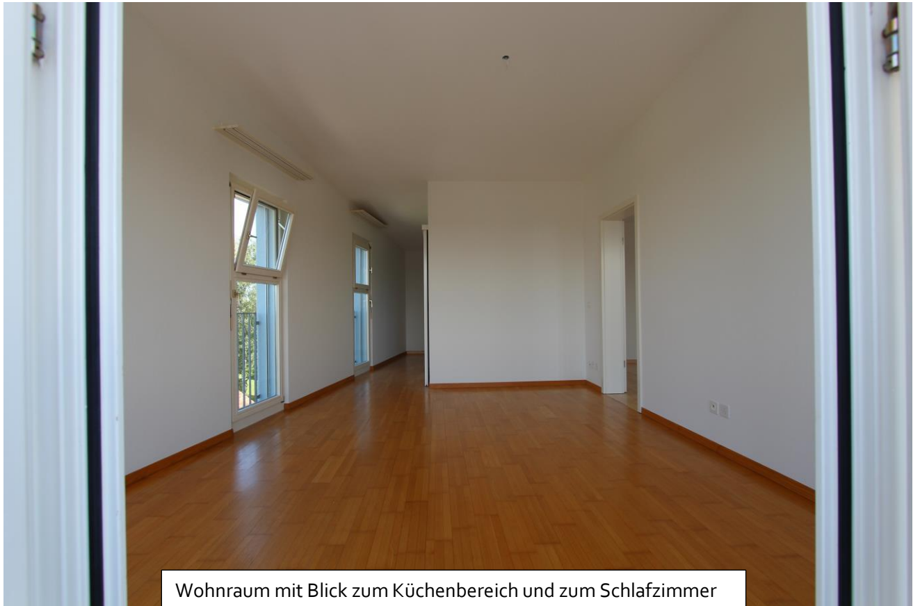
Wohnraum mit Blick zum Küchenbereich und zum Schlafzimmer