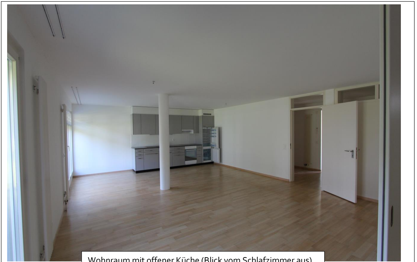
Wohnraum mit offener Küche (Blick vom Schlafzimmer aus)