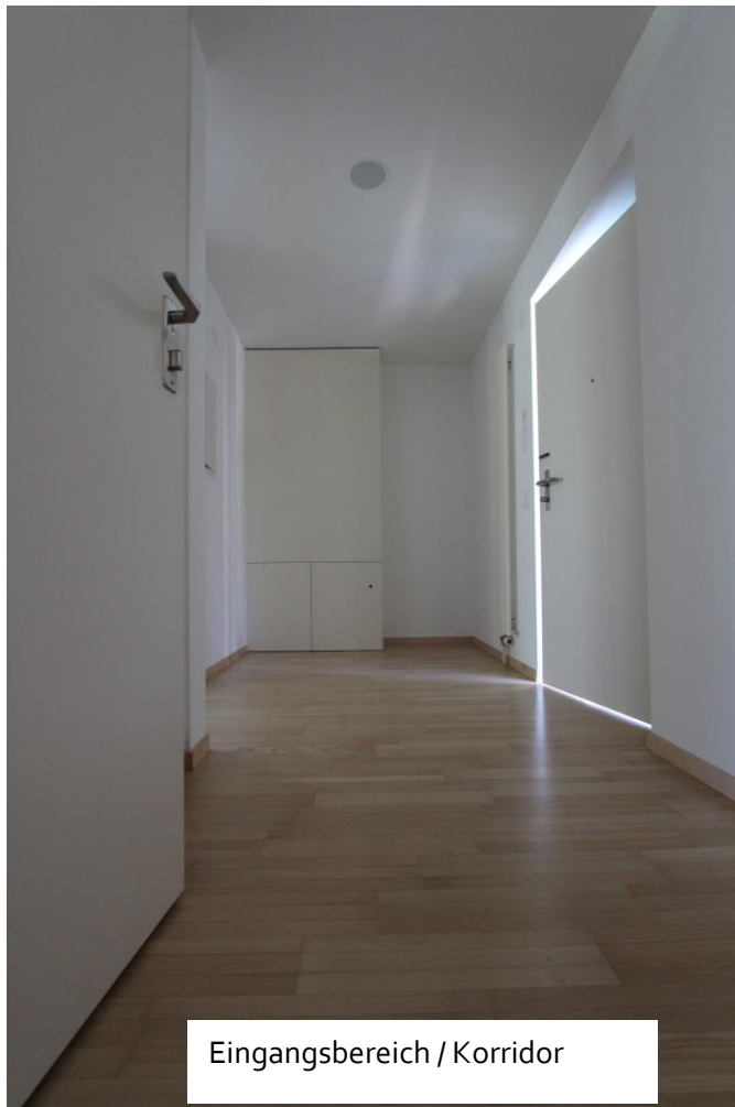
Eingangsbereich / Korridor