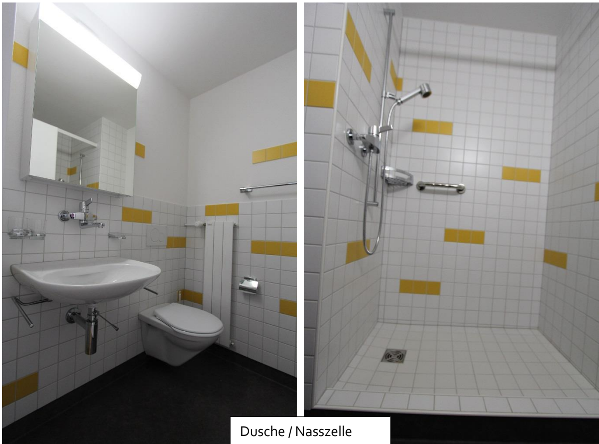
Dusche / Nasszelle