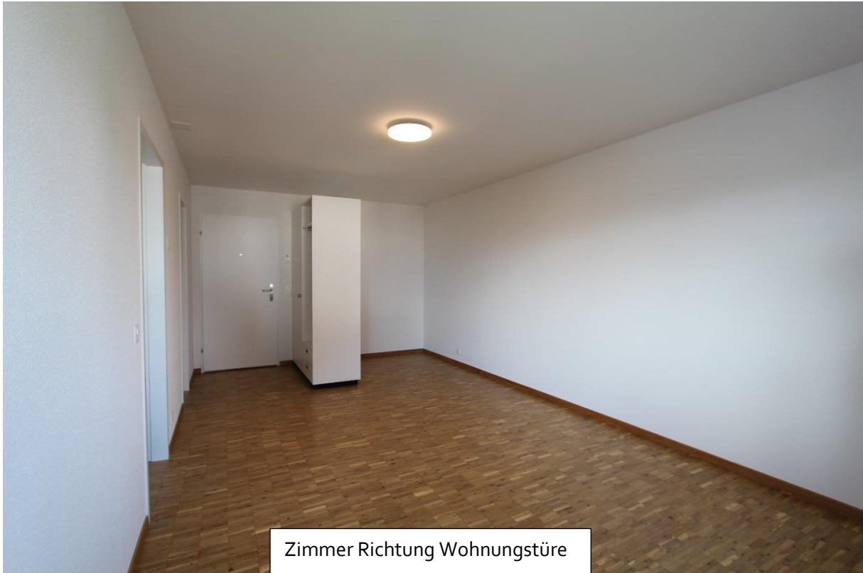
Zimmer Richtung Wohnungstüre